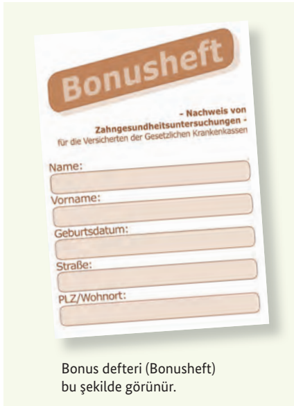
Bonus defteri (Bonusheft) bu şekilde görünür.

Sağlıklı dişler yaşam kalitesinin bir parçasıdır. Bu nedenle düzenli yapılan koruyucu muayeneler, şikâyetiniz olmasa da önemlidir. Yasal sağlık sigortaları bu koruyucu önlemlerin masraflarını da karşılamaktadır. Bu muayeneler belli hastalıkların erken teşhisi ve tedavisinde yardımcı olurlar. Sigorta kurumunuzdan bu uygulama için “bonus defteri” (Bonusheft) olarak adlandırılan bir defter alabilirsiniz. Bu deftere koruyucu muayeneler yazılır. Diş hekimine yılda en az bir kez (18 yaşın altında en az altı ayda bir) gittiğinizi belgeleyebilirsiniz, sigorta kurumunuz, diş protezi gerekli olduğunda daha fazla bir ödeme yapmaktadır.