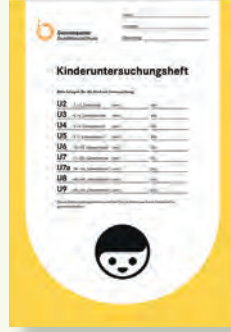
U-defteri (U-Heft) bu şekilde görünür

Muayeneler çok önemlidir. Bu nedenle bütün bu muayeneleri dikkate alın ve her zaman çocuğunuzun muayene defterini (U-defteri = U-Heft) ve aşı karnenizi yanınızda getirin. “U” muayeneleri çocuğunuzun sağlığı için önemlidir.