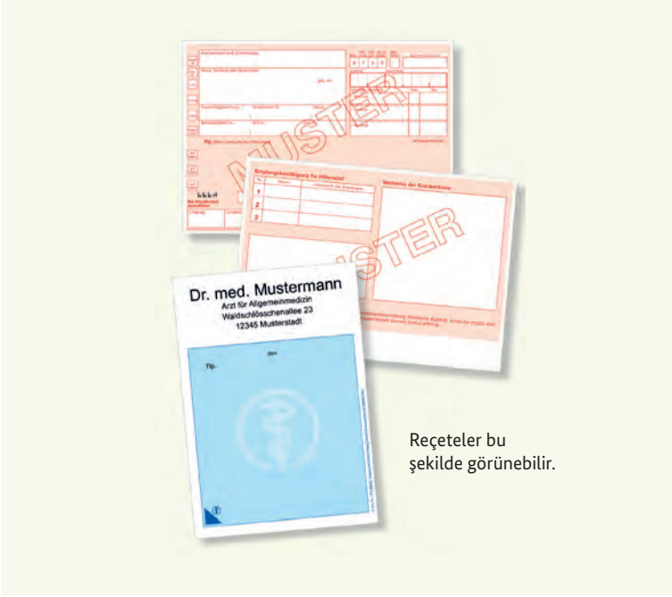
Reçeteler bu şekilde görünebilir.