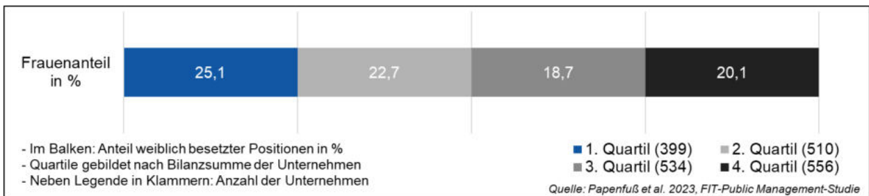
Abbildung 3: Größenklassenvergleich zur Repräsentation von Frauen in Positionen der Top-Managementorgane öffentlicher Unternehmen auf der kommunalen Ebene

Weiterhin ist die Betrachtung des Frauenanteils in Top-Managementorganen für Unternehmen verschiedener Größenklassen aufschlussreich. Als Merkmal für die Unternehmensgröße wurde die Bilanzsumme der Unternehmen herangezogen, da diese ein maßgebliches Entscheidungskriterium zur Größenklassenkategorisierung nach § 267 HGB darstellt und unabhängig von handelsrechtlichen Erleichterungsvorschriften in den Bilanzen jährlich offengelegt wird. In der folgenden Abbildung 3 werden die Unternehmen einer Größenklasse zugeordnet. Die Größenklassen bemessen sich anhand der berechneten Quartile bzw. Quartilsgrenzen. Die unterste Größenklasse enthält die 25 % kleinsten Unternehmen mit einer Bilanzsumme unter 1,8 Mio. Euro (1. Quartil). Die nächstgrößere Größenklasse enthält die 25 % nächstgrößten Unternehmen mit einer Bilanzsumme bis 13,1 Mio. Euro (Median). Die weiteren Größenklassen liegen zwischen 13,1 Mio. Euro und 128,0 Mio. Euro (3. Quartil) bzw. über 128,0 Mio. Euro Bilanzsumme (4. Quartil). Innerhalb der Balken wird der Anteil an weiblich besetzten Top-Managementpositionen je Größenklasse dargestellt.